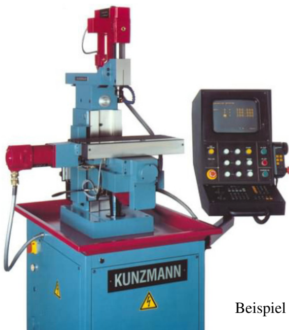
Beispiel Maschine mit TNC360